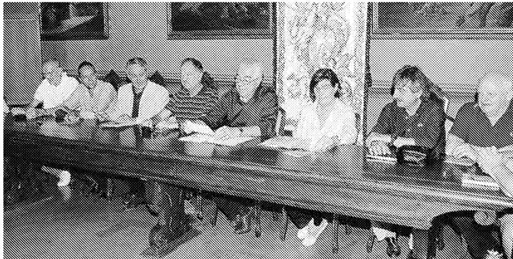
Il tavolo dei relatori alla presentazione del Gnaker