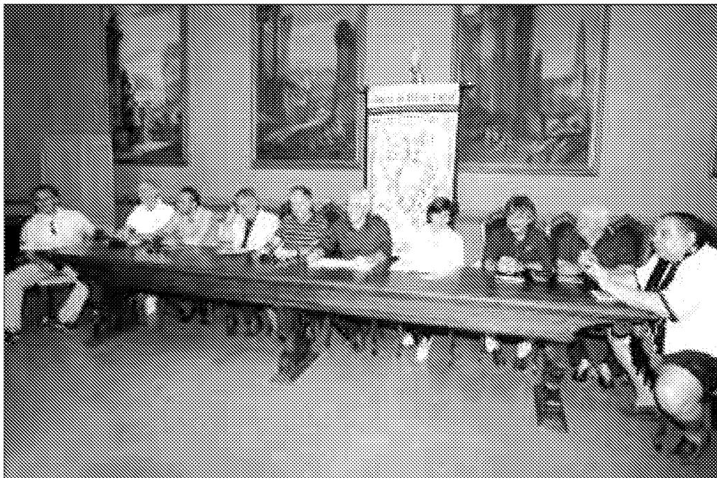
La conferenza stampa di presentazione del Gnaker