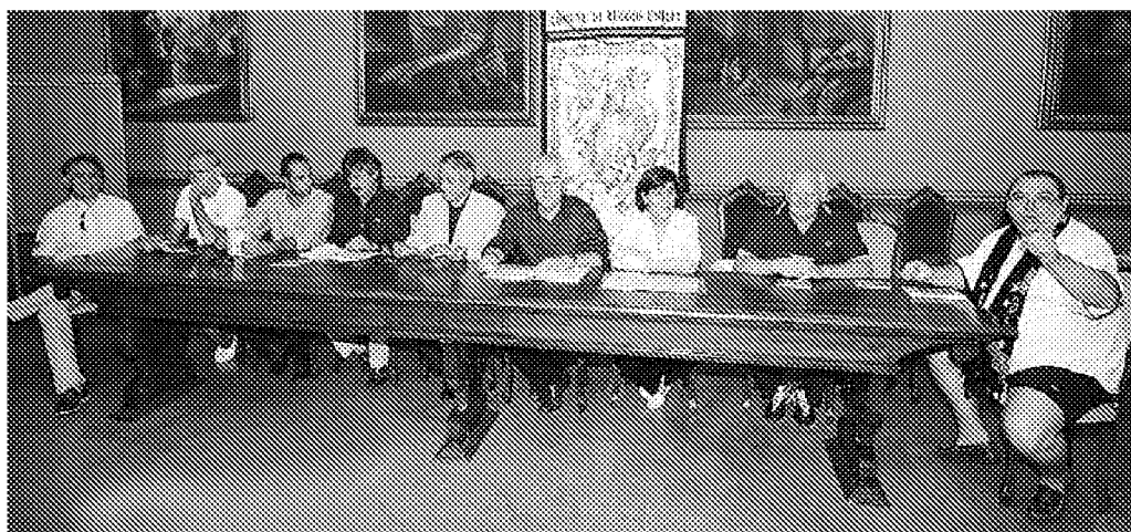
Il tavolo dei relatori alla presentazione del torneo Gnaker 2011